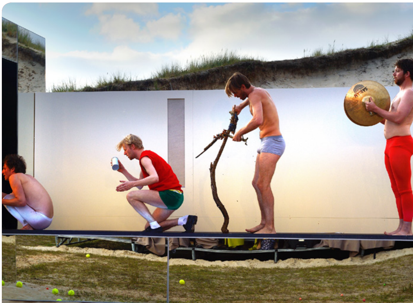
ONE HOT MINUTE

PMP zet het logo en de huisstijl offline door, door middel van het herkenbare logo of banners op eventuele posters en/of flyers van projecten, alsmede door bannering bij events.